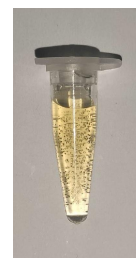
图 3. 二氧化锰纳米片使 H 2 O 2 快速释放氧气

针对不同需求的用户，我们派出东纳公司专家团队，配合指导客户使用，为客户取得最好的实验效果。